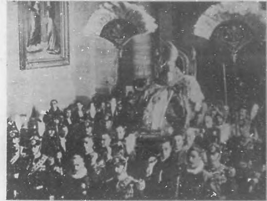
Su Santidad Pío X es llevado a la gran ceremonia de la investidura de los nuevos cardenales. Esta escena, que ni aún yendo a Roma sería posible contemplarla, es reproducida en el cinematográfico, gracias a un joven americano.