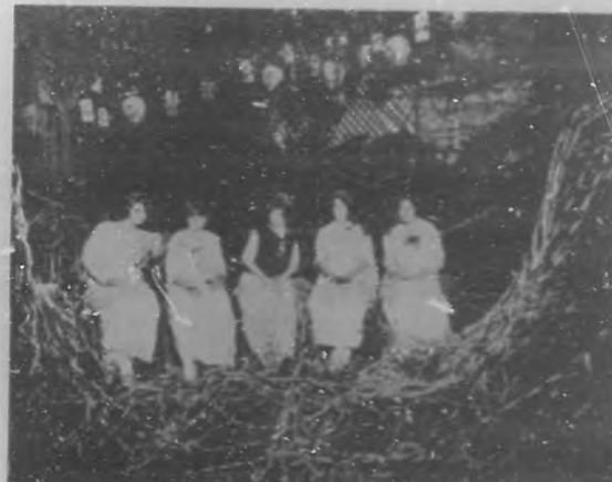
EN MIRAMAR. —La Reina del Carnaval y su Corte en el trono levantado en dicho jardín, la noche del "baile veneciano", dado en su honor.