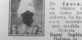
PELUCAS DE CARNAVAL. De época, en blanco y en todos los colores. Se hacen también por medida. Sederia Bazar Inglés, Galiano 72.