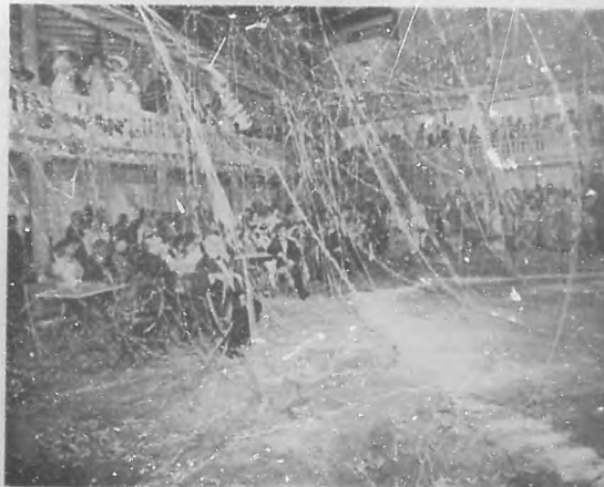
EN MIRAMAR. —Fotografía en que se ve la maraña de serpentina que constituyó la noja alegre del baile veneciano.