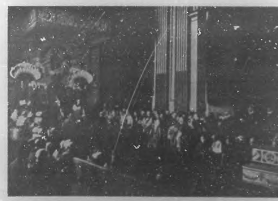
Esta vista fué tomada en el salón del consistorio del Vaticano, en la ceremonia de la investidura de los nuevos cardenales. En el grupo está el nuevo Papa, Benedicto XV, entonces Cardenal.