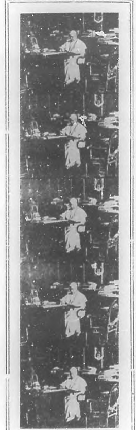
Su Santidad Pío X en su gabinete de trabajo, donde son escritos los mensajes que el Jefe de la Iglesia Católica envía a los 250 millones de católicos del mundo entero.

Se sentó Pío X en una silla que Slevin había colocado en el lugar más apropiado; a su derecha tomó asiento Merry del Val y a su izquierda el americano. Detrás estaban los demás asistentes. Slevin se refiere con entusiasmo a aquellos momentos, en los que recordaba que en el magnífico salón en que estaba habían sido coronados reyes y emperadores.