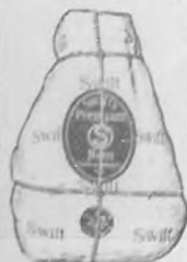
JAMON MARCA "PREMIUM."