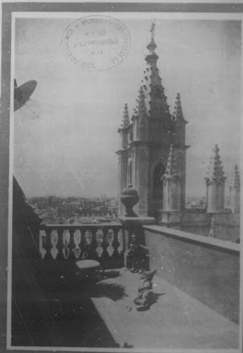
HABANA-ARTISTICA Interesante estudio fotográfico hecho en una sesión, a su costado de la Iglesia del Angel, desde la cual se divisa parte de la ciudad.