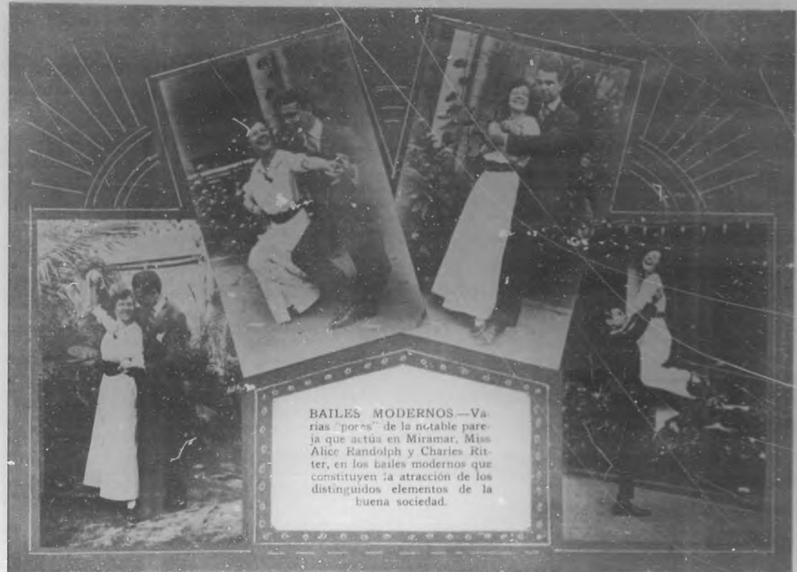
BAILER MODERNOS—Varias "poses" de la notable pareja que actúa en Miramar...